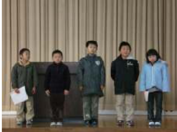
◇始業式で順に挨拶する1・2年生◇