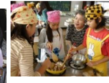
ふるさと選択学習