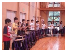
2泊3日 佐渡体験旅行(6年)