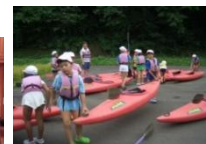
子ども自然王国 宿泊体験(4年)